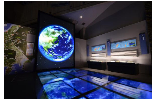
フォッサマグナミュージアム館内

※当日は、地球や日本列島の誕生をわかりやすく展示した、石の博物館「フォッサマグナミュージアム」(糸魚川市)から生配信します。