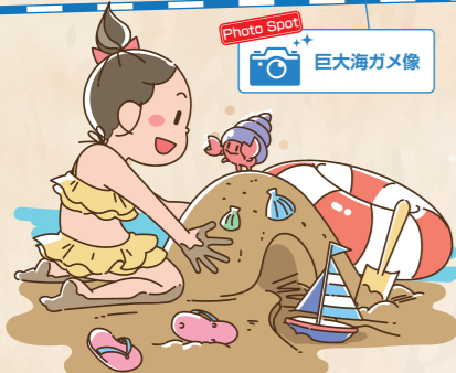
Photo Spot 巨大海ガメ像