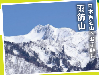
雨飾山 日本百名山へお手軽に

猫の耳と呼ばれる2つの山頂が特徴的な標高1,963mの山で、日本百名山に選ばれています。